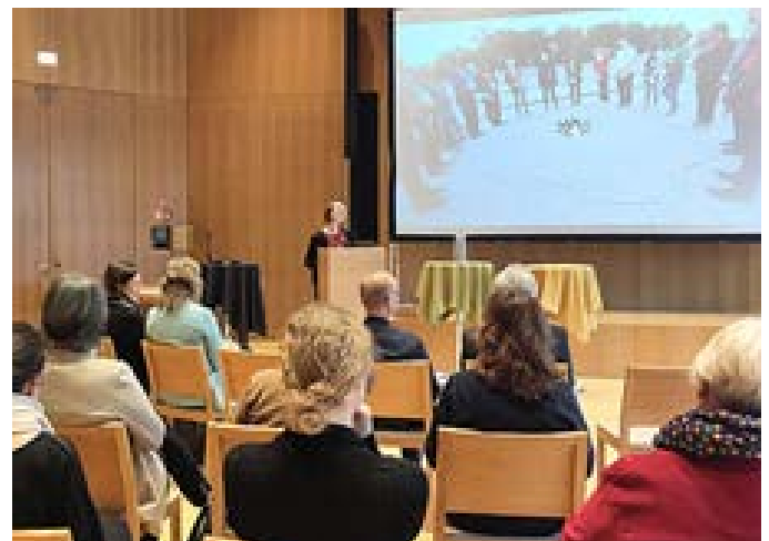
Fachtag Ökumene, 26. Januar 2024, in Leipzig