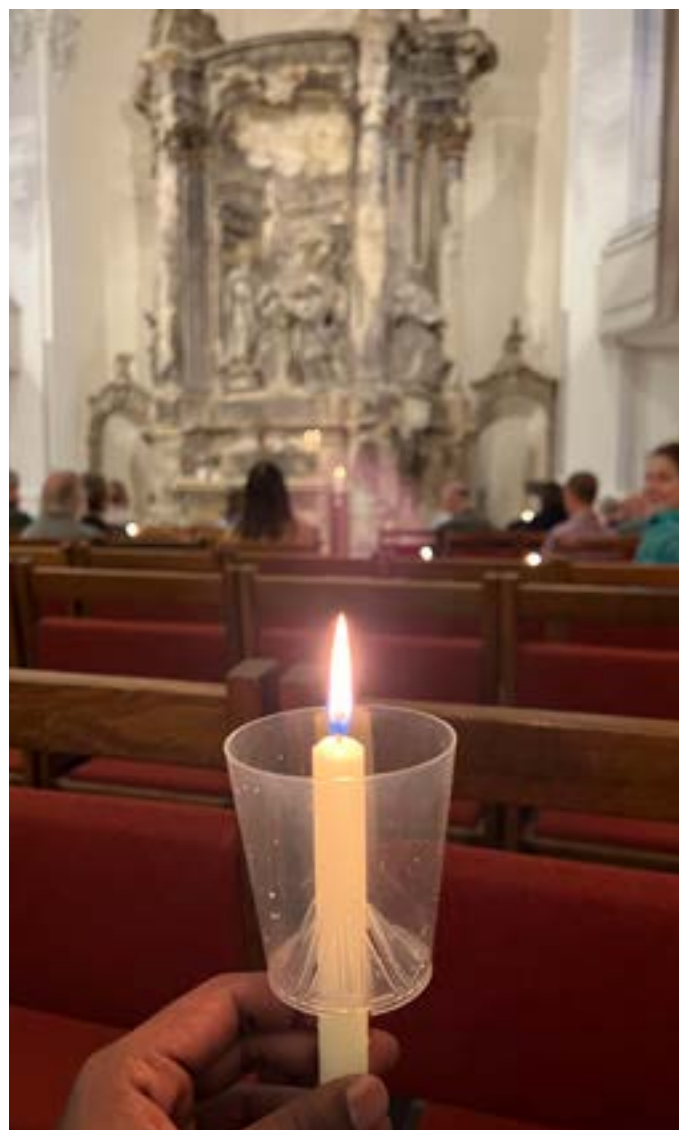
Abendandacht in der Dreikönigskirche im Rahmen der Veranstaltung „Hoffnung für die Erde leben“ am 14.09.2024, gestaltet von Aktiven des Ökumenischen Wegs