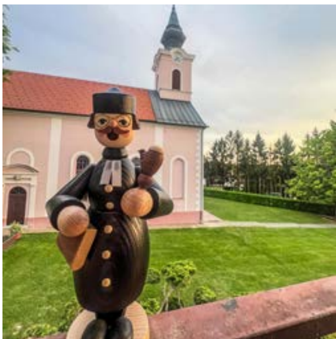
Ein Räuchermännchen-Pfarrer aus dem Erzgebirge vor der evangelischen Kirche in Križevci. Pfarrer Mitja Andrejek postierte seinen Kollegen – ein Gastgeschenk des GAW Sachsen – vor heimischer Kulisse.

Die Brücken zu anderen Glaubensgemeinschaften im Land sind stabil. Die Evangelische Kirche A. B. in Slowenien unterhält Verbindungen zur serbisch-orthodoxen, zur katholischen und zur reformierten Kirche, zur Pfingstkirche, aber auch zur jüdischen und islamischen Gemeinschaft. Mit der ungarischen Diakonie engagierten sich die Gemeinden am Grenzübergang zur Ukraine in der Flüchtlingsarbeit. Auch mit ungarischen Gemeinden gebe es grenzübergreifend gute Zusammenarbeit.