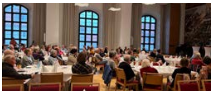
Begrüßung mit Zeitzeugengesprächen und einem festlichen Abendessen im Dreikönigsforum

Von März bis September 2024 fanden bundesweit eine Vielzahl von Veranstaltungen zu den drei Themen statt. Online und analog, Vorträge, Workshops und innovative Formate. Auch in Sachsen gab es viele Veranstaltungen, wie beispielsweise zwei Podiumsgespräche der Evangelischen und Katholischen Akademie zum 35-jährigen Jubiläum der Ökumenischen Versammlungen und verschiedene Angebote der Arbeitsstelle Gerechtigkeit, Frieden, Bewahrung der Schöpfung.