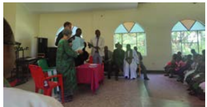
Unterzeichnen des gemeinsamen Scholarshipabkommens

Benedikt Spatz Evangelisch-Lutherische Marienkirchengemeinde zu Leipzig-Stötteritz