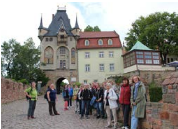
Die Frauen des Partnerschaftstreffens 2024

Jedes Jahr steht es unter einem anderen Thema, bei dem jede ihre Erfahrungen einbringen kann. So erleben wir, als Frauen aus verschiedenen Ländern, dass wir gemeinsam unterwegs sind. Deutlich wurde dies u. a. daran, dass die Zeit zum Austausch meist viel zu kurz war, es gab vieles aus dem letzten Jahr von allen Seiten zu berichten, ein kunterbuntes Sprachengewirr. Ein wichtiger Ort für die Gespräche war die Küche, wenn gemeinsam gekocht und abgewaschen wurde. Von wegen „viele Köche verderben den Brei“ – bei Köchinnen ist das jedenfalls nicht der Fall.