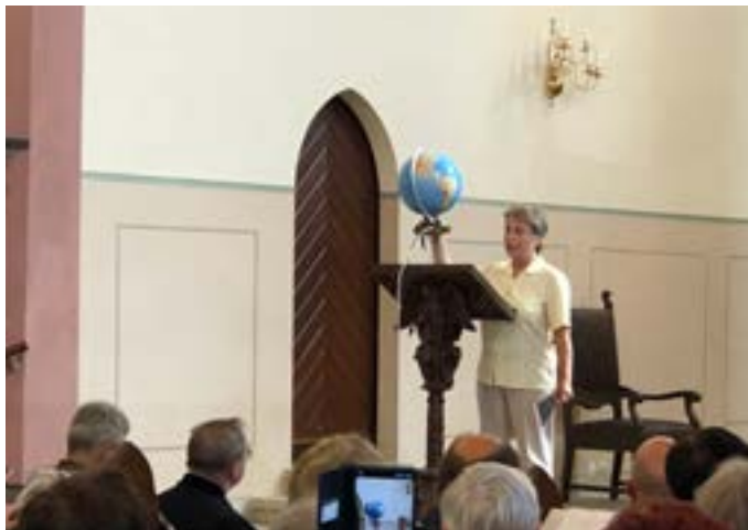
Ein Globus als Symbol der Verbundenheit zwischen Menschen aus unterschiedlichen Ländern

vertieften die Botschaft der menschlichen Verbundenheit und des Zusammenhalts untereinander.