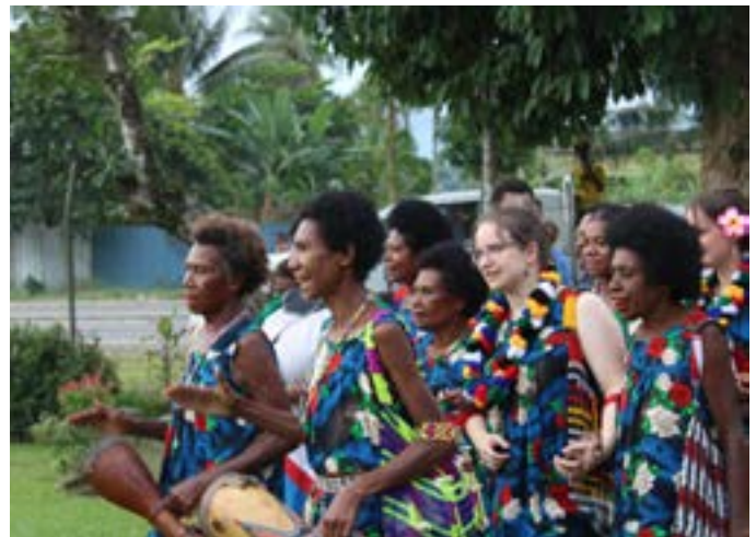
Begrüßungstanz für die Mädchen in den Gastfamilien

eigenen Leben Mut zu neuen Bekanntschaften aufzubringen. Die Jugendlichen haben eine große Gastfreundschaft und Nächstenliebe vor Ort erfahren und wollen sich diese im Alltag bewahren. Jeder Jugendliche hat neue Dinge gelernt, wie das Zubereiten von Essen in Tontöpfen oder Bambusstämmen, den Geschmack von Zuckerrohr, anderen Bananen und Sago, viele neue Lieder und beschwingte Tänze.