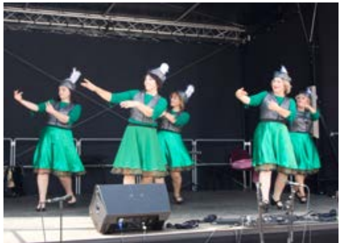
Die Tanzgruppe des Vereins „Zusammenleben“ aus Torgau beim Bühnenprogramm

Erstmals nach der Corona-Pandemie und dem Beginn des russischen Angriffskriegs auf die Ukraine gab es in diesem Jahr wieder ein vielfältiges buntes und öffentlichkeitswirksames Programm für Kinder und Erwachsene auf dem Markt. Dort war auch die Hauptbühne aufgebaut sowie der Markt der Möglichkeiten mit verschiedenen Ständen von Initiativen und Vereinen. Parallel wurden zudem Besuche auf dem Kirchturm, im Heimatmuseum sowie eine Fahrt zur historischen Dampfmaschine Roßwein angeboten.