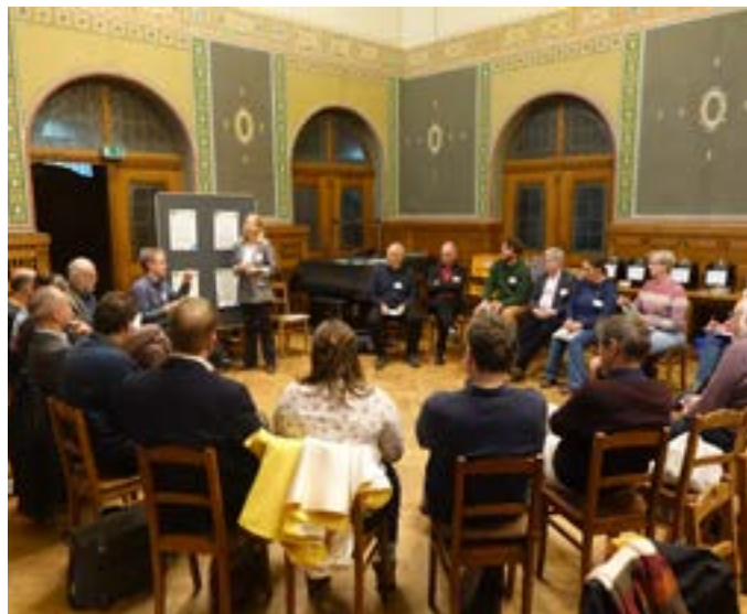
Regionalkonferenz zum Klimaschutzkonzept in Dresden am 17. April 2024

Im Frühjahr 2024 wurden dann drei Regionalkonferenzen und eine Onlinekonferenz ausgerichtet, zu denen Vertreterinnen und Vertreter aller Kirchgemeinden sowie kirchliche Umweltinitiativen eingeladen waren. Das Hauptanliegen der Konferenzen war das Einholen von Rückmeldungen zum ersten Entwurf der Maßnahmen im Klimaschutzkonzept. In moderierten Workshops wurden einzelne Maßnahmen aus den Bereichen Gebäude, Energie, Mobilität und Beschaffung anhand von Leitfragen diskutiert, wie z. B. „Welche Aspekte sind gut umsetzbar?“, „Wo liegen Probleme?“.