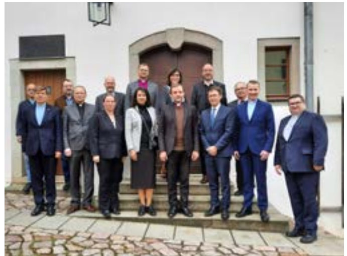
Die Teilnehmenden der Lettisch-Sächsischen Konsultation in Meißen

Auf der Konsultation in Meißen wurde in Bibelarbeiten und Vorträgen die gemeinsame Grundlage des Glaubens reflektiert. Dabei kamen auch die unterschiedlichen Auffassungen zu den Themen Frauenordination und Sexualethik zur Sprache. Ebenso wurde auch die Bedeutung des Lutherischen Weltbundes als communio der Kirchen diskutiert. Bei allen Unterschieden