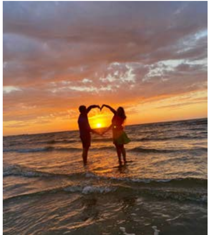
Urlaub an der Ostsee dank der Förderung durch die Solidarkasse

Mein Privileg ist, durch die Begegnungen auch immer wieder Horizonterweiterung zu erfahren. Ich möchte benennen: Die Arbeitsmethoden in Diasporakirchen zeigen wohl an, in welche Richtung unsere Wege führen könnten. Ich lernte viel über ein