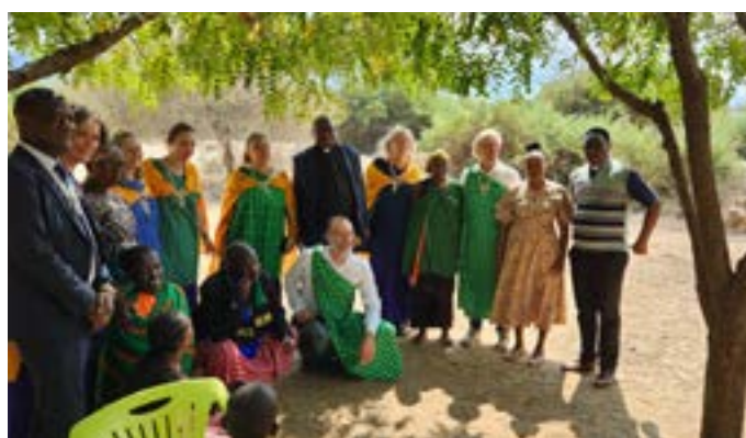
Gruppenfoto beim Empfang in einer Kirchengemeinde

Vom 21. August bis 7. September 2024 reiste eine Delegation nach Tansania, um die dortigen Partnergemeinden in Arushachini und Chemchem zu besuchen. Insgesamt neun Personen vertraten die Gemeinden Leipzig-Stötteritz und Hannover-Marienwerder in Tansania. Die Anzahl der Partnergemeinden auf tansanischer Seite ist stetig am Wachsen, so dass in diesem Jahr bereits sieben Gemeinden besucht werden konnten. Dementsprechend groß und überwältigend war auch der Empfang der Gäste direkt nach der Ankunft am Flughafen Kilimanjaro, wie auch in jeder einzelnen Gemeinde. Es wurde vor Freude gesungen, getanzt und gegessen. Viel gegessen ... Bemerkenswert, welchen Aufwand und organisatorisches Feingefühl das tansanische Partnerschaftskomitee im Vorfeld aufbrachte. Denn es war kein Leichtes, die nötige Balance für diese Reise zu finden. Besuche von sieben Gemeinden, der Superintendentur und beim Bischof von Moshi standen auf dem Programm.