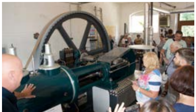
Besuch der historischen Dampfmaschine Roßwein