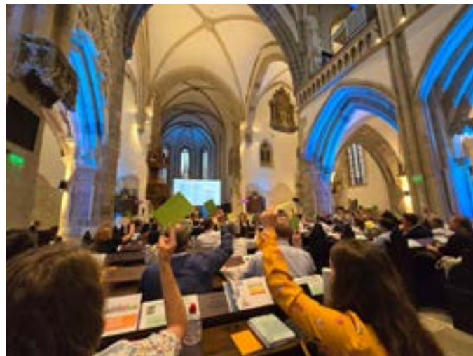
Stadtpfarrkirche Hermannstadt, Tagungsort der 9. GEKE-Vollversammlung

Superintendent Harald Pepel Ev.-Luth. Kirchenbezirk Zwickau