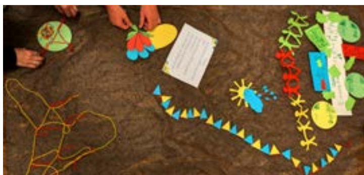
Workshop auf der Tagung „Hoffnung für die Erde leben“.