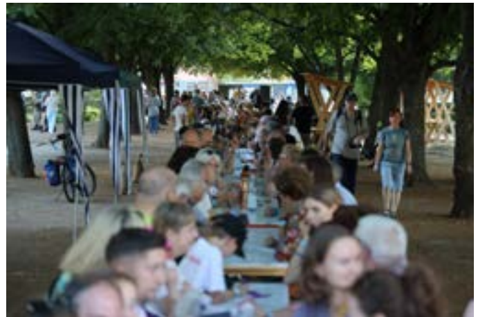
»Tischmahl der 4.000«

Weitere Gruppen kamen aus Tschechien, der Slowakei, Ungarn, Rumänien, Österreich und einigen deutschen Landeskirchen, so auch aus unserer sächsischen Landeskirche. Die größte Gruppe war aus unserem Nachbarland Polen gekommen. Alle diese Gäste nahmen am Samstagabend an einer kilometerlangen