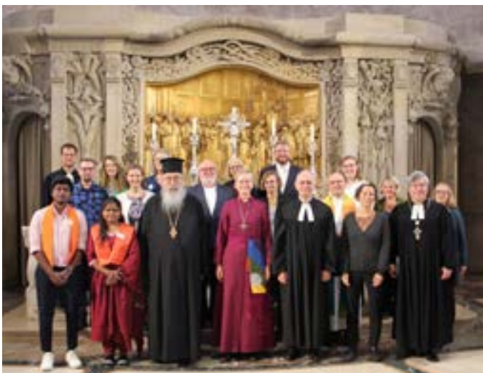
Die Beteiligten des Abschlussgottesdienstes in der Dresdner Kreuzkirche