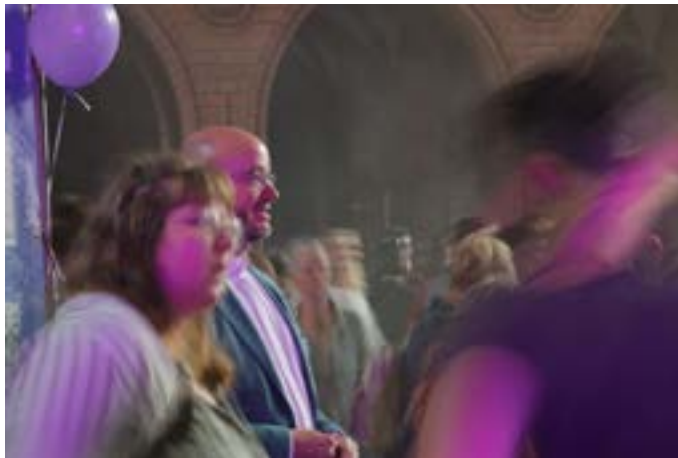
Technogottesdienst mit Landesbischof Tobias Bilz

In morgentlichen Bibelfrühstücken in den Gemeinschaftsunterkünften oder in den Bibelarbeiten in Kirchen wurden Gedanken aus Römer 8 reflektiert. Eine Vielfalt von Themen wurde in Podien und Workshops bedacht. Chöre aus verschiedenen Kirchen fanden sich zu einem großen Chorkonzert zusammen.