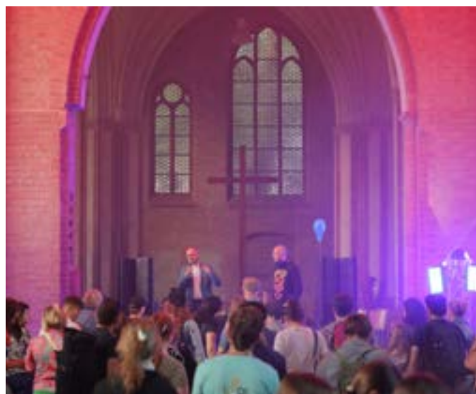
Technogottesdienst mit Landesbischof Tobias Bilz

Und in der Tat: Diese Begegnungstage ließen die Begeisterung neu aufkommen und wurden zu einem geradezu pfingstlichen Ereignis. Das war vor allem an der Vielfalt der Sprachen erkennbar. Die Organisatoren hatten keine Mühe gescheut, für Übersetzung zu sorgen, sei es über eine App, die erstaunlich gut funktionierte und in alle Sprachen der Teilnehmenden übersetzte, oder über Einblendungen auf den Bildschirmen oder Versuche, das Motto in der Sprache der anderen zu sprechen. So geschehen beim Eröffnungsgottesdienst.