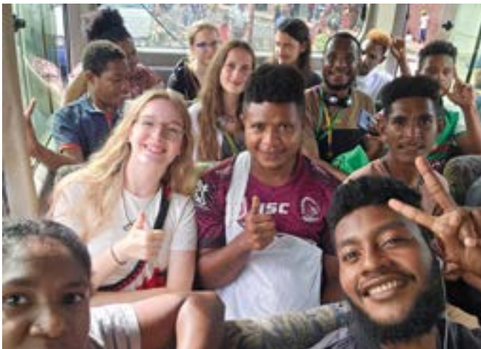
Unterwegs – Busfahrt zu einem Second Hand Shop

eigenen Leben Mut zu neuen Bekanntschaften aufzubringen. Die Jugendlichen haben eine große Gastfreundschaft und Nächstenliebe vor Ort erfahren und wollen sich diese im Alltag bewahren. Jeder Jugendliche hat neue Dinge gelernt, wie das Zubereiten von Essen in Tontöpfen oder Bambusstämmen, den Geschmack von Zuckerrohr, anderen Bananen und Sago, viele neue Lieder und beschwingte Tänze.