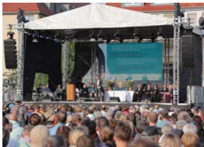
Eröffnungsgottesdienst der Christlichen Begegnungstage in Frankfurt/Oder

Vom 7. bis 9. Juni 2024 feierten Christinnen und Christen aus Mittel- und Osteuropa ein großes Fest des Glaubens. Unter dem Motto „Nichts kann uns trennen“ kamen ca. 4800 Menschen aus dieser europäischen Region in die Doppelstädte Frankfurt an der Oder und Słubice. Dabei war das Motto ein Ausdruck der Hoffnung. Schließlich hatte die COVID-Pandemie zwei Versuche, die Christlichen Begegnungstage durchzuführen (2020 und nochmals 2022) zunichte gemacht. Seit den Begegnungstagen 2016 in Budapest waren immerhin 8 Jahre vergangen. Eine lange Zeit, in der diese Art der Begegnung schmerzlich vermisst wurde. Und es war schon die bange Frage, ob es gelingen würde, die Idee wieder aufleben zu lassen und dafür Menschen aus vielen Ländern zu begeistern.