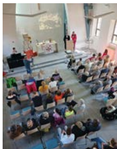
Der Blick aufs große Ganze: eine Veranstaltung in der deutsch-französischen Begegnungskapelle (Chapelle de la Rencontre) an der Grenze zwischen Kehl und Strasbourg.