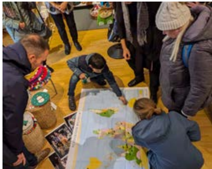
Workshop zum Fairen Handel beim Ökumenischen Thementag 2024

die Erde leben“ aktiv dabei und gestaltete die Andacht am Samstagabend zum Thema „Hoffnung“. Ebenfalls gab es von Mitwirkenden des Ökumenischen Wegs einen Workshop zur persönlichen Auswertung der Tagung, welcher mit Schere, Kleber und Stiften die Teilnehmenden einlud, Punkte von Hoffnungslosigkeit und von Hoffnung zu reflektieren (s. auch den Bericht von Miriam Meir, S. 3).